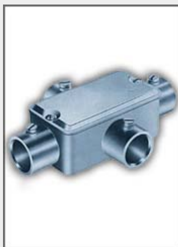
Condulete com tampa

Tendo ainda a opção de utilização abrigada onde fica em área coberta ou ainda ao tempo, onde se utilizam peças com vedações contra tempo, pó, vapores e água.