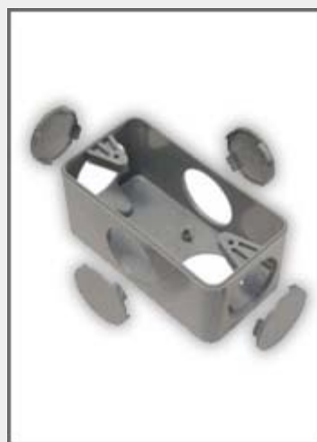
Condulete PVC Múltiplo